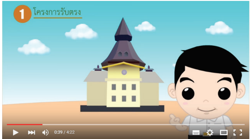
การรับสมัครบุคคลเข้าศึกษาใน มธ. ระดับปริญญาตรี

สถานี “NuREG Thammasat” น้องๆ นักเรียน นักศึกษาคนไหนคุ้นหูบ้างเอ่ย ? วันนี้เรามาทำความรู้จักกันอีกครั้งดีกว่า... สถานี “NuREG Thammasat” คือ สถานีใน YouTube ที่แพร่เผยวิดีโอความรู้ต่างๆ มากมายของสำนักทะเบียนและประมวลผล ที่คอยอัพเดทเรื่องราวงานบริการทางการศึกษาให้กับนักเรียน และนักศึกษามาอย่างต่อเนื่อง