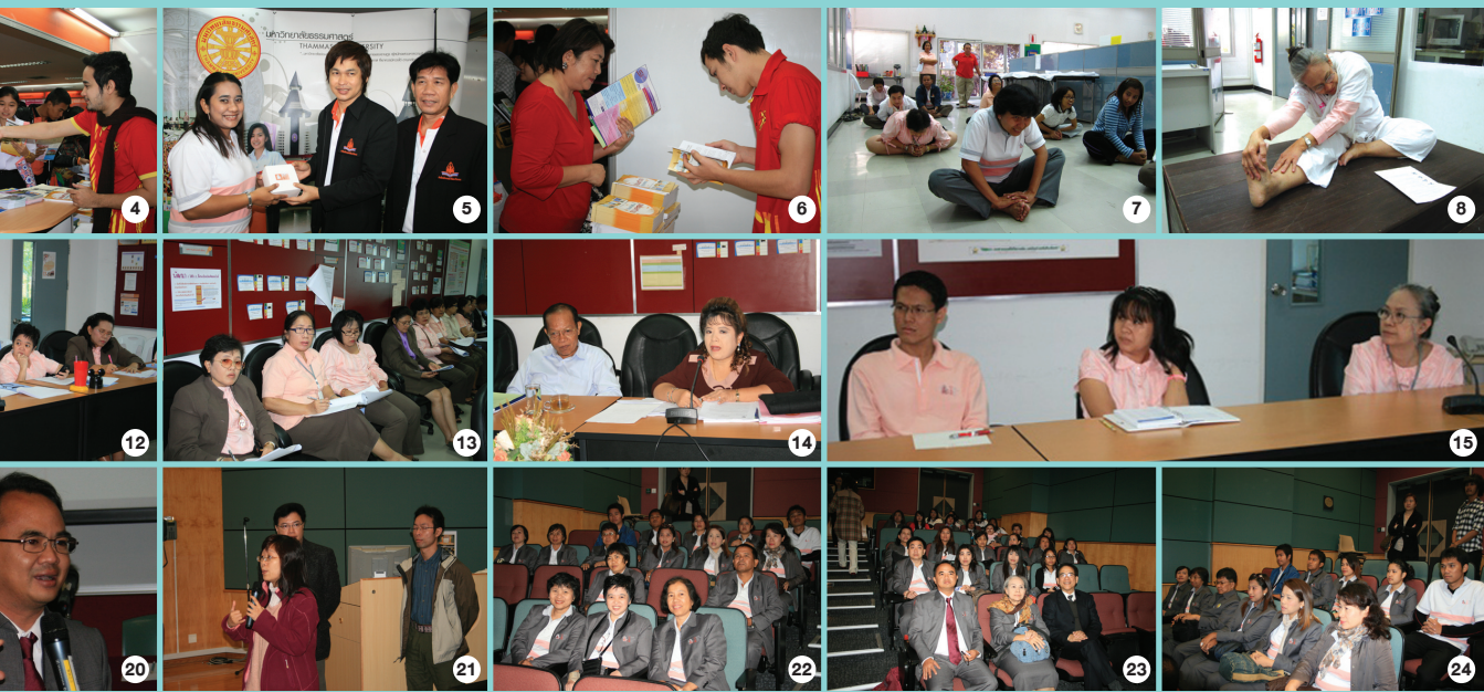
ม 2554 สท. เข้าร่วมงานตลาดนัดหลักสูตร ครั้งที่ 15 ณ มหาวิทยาลัยขอนแก่น โดยมีผู้เข้าชมมูรของมหาวิทยาลัยธรรมศาสตร์