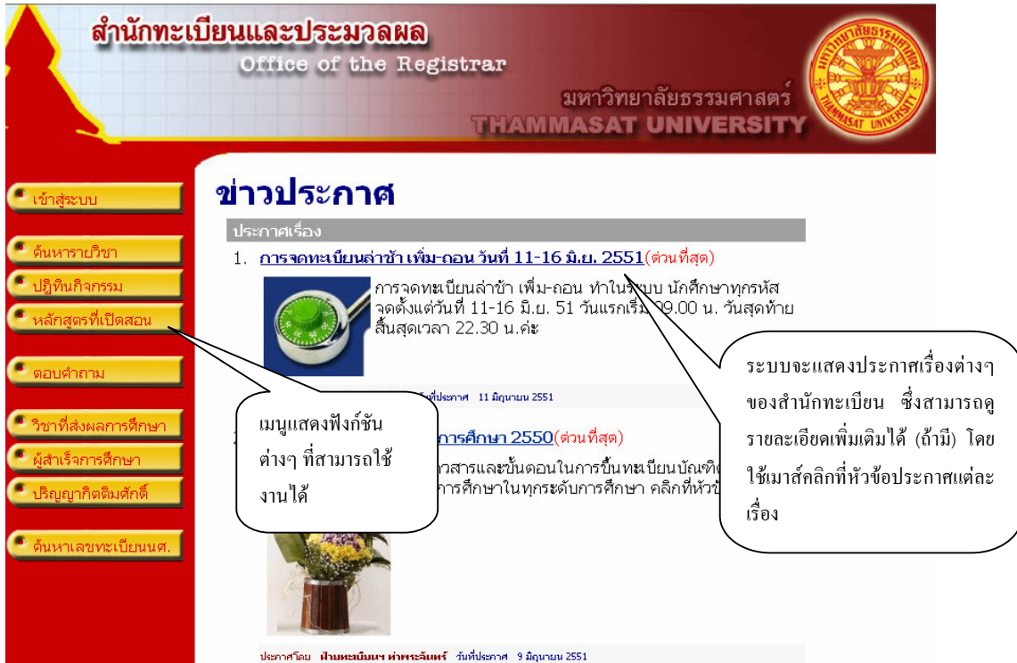
รูปที่ 2 หน้าจอเมื่อเข้าสู่ URL ของสำนักทะเบียนและประมวลผล

ท่านสามารถใช้งานระบบสารสนเทศเพื่อการบริหารทางการศึกษาได้จากเครื่องคอมพิวเตอร์ทุกเครื่องที่เชื่อมต่ออยู่กับระบบเครือข่ายของมหาวิทยาลัย และ/หรือ เครือข่ายอินเทอร์เน็ต โดยการกำหนด Location หรือ Netsite ในโปรแกรม Internet Explorer ไปที่ URL ( www.regofc.tu.ac.th ) ที่ทางมหาวิทยาลัยกำหนด แล้วกดปุ่ม Enter ระบบจะนำท่านไปสู่ข้อมูลพื้นฐานทั่วไป ซึ่งทุกคนสามารถใช้งานได้ตามจอภาพต่อไปนี้