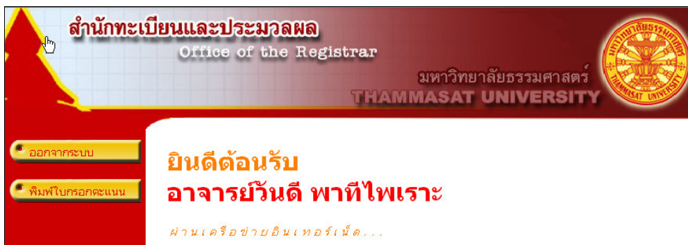
รูปที่ 14 หน้าจอของระบบเจ้าหน้าที่

เมื่อท่านเข้าสู่ระบบเรียบร้อยแล้ว ระบบจะแสดงหน้าจอเมนูหลัก โดยมีเมนูแสดงฟังก์ชันต่าง ๆ ที่ท่าน สามารถใช้งานได้แสดงทางด้านซ้ายของจอภาพ ในรูปที่ 14