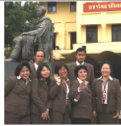
ฝ่ายทะเบียนและประมวลผล ท่าพระจันทร์

ส่งเกรดง่าย ๆ ผ่านทาง Internet นักศึกษาเห็นในใบเกรดเลย