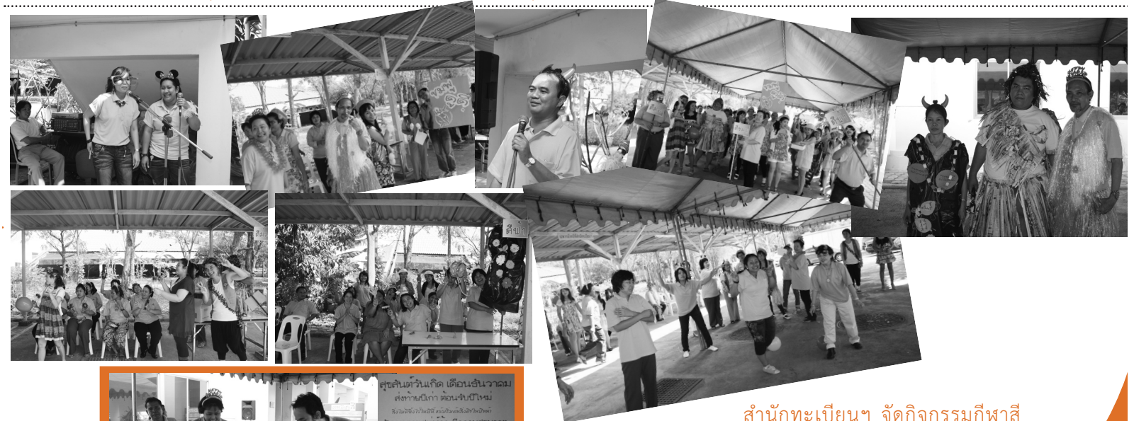
สำนักทะเบียนฯ จัดกิจกรรมกีฬา ประจำปี เมื่อวันที่ 29 ธันวาคม 2552 โดยแบ่งออกเป็น 3 สี ฟ้า ชมพู และม่วง ประชาคมของสำนักทะเบียนฯ ร่วมแข่ง กีฬา นันทนาการ พร้อมทั้งมีการประกวดชุดลดภาวะโลกร ร้อน เพื่อเชื่อมความสัมพันธ์ที่ดีให้กับองค์กร