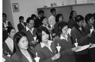
สำนักทะเบียนและประมวลผล จัดพิธีจุดเทียนชัยถวายพระพร พระบาทสมเด็จพระเจ้าอยู่หัว ภูมิพลอดุลยเดช เนื่องในโอกาสวันเฉลิมพระชนมพรรษา 82 พรรษา 5 ธันวาคม 2552 เมื่อวันที่ 3 ธันวาคม 2552 ณ ห้องโถงชั้นล่าง