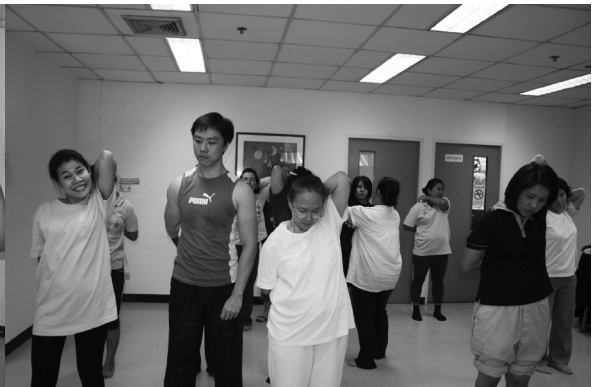
สำนักทะเบียนฯ จัดกิจกรรมโยคะเพื่อสุขภาพ ฟรี เมื่อวันที่ 18 ธันวาคม 2552 ณ ห้องโถงชั้น 2 ดำเนินการสอนโดยการนำของครูที่มากด้วยประสบการณ์และเป็นที่ยอมรับ พี่น้องชาวสำนักฯ ให้ความสนใจเข้าร่วมโครงการเป็นจำนวนมาก