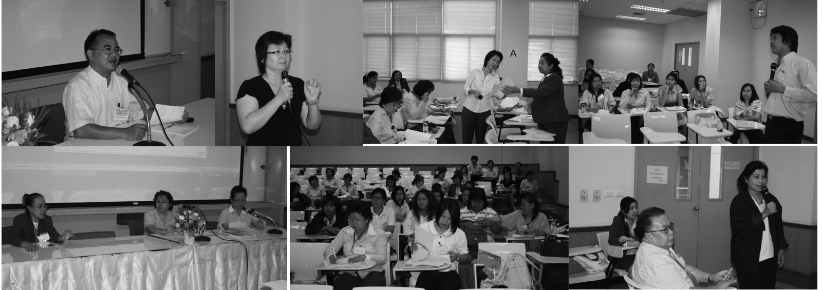
สำนักทะเบียนฯ จัดประชุมเชิงปฏิบัติการเครือข่าย มธ. พบกันเป็นครั้งที่ 2 KM Forum : พุดคุยกันด้วยเรื่องข้อบังคับมหา วิทยาลัยธรรมศาสตร์ฯ หัวข้อ “เงื่อนไข ขั้นตอน การเปิดวิชาเพิ่ม/ปิดรายวิชาและการคืนเงินค่าธรรมเนียม” เมื่อวันที่ 22 ธันวาคม 2552 ณ อาคารเรียนรวมทางสังคมศาสตร์ (SC)