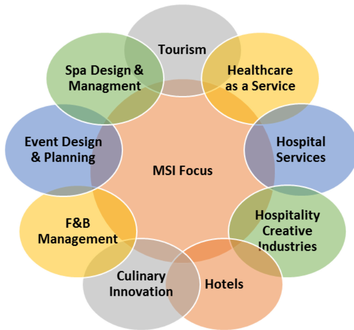
แผนภาพ: องค์ประกอบของภาคการบริการสาขาต่าง ๆ ที่หลักสูตรให้ความสำคัญ