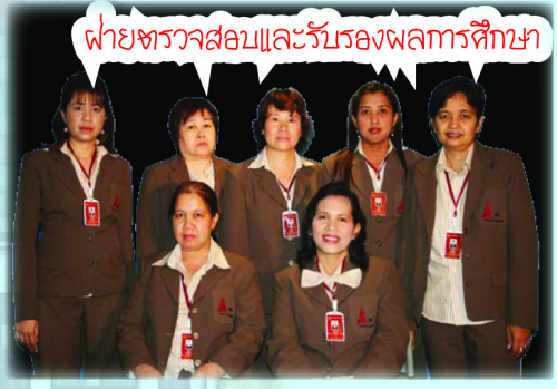
ฝ่ายตรวจสอบและรับรองผลการศึกษา