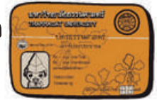
บัตรนักศึกษา Smart Card แบ่งออกเป็น 2 ส่วน