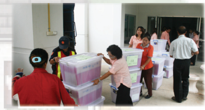
จัดส่งไปยังหอประชุมใหญ่...