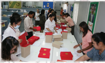
จัดเรียงปริญญาบัตร