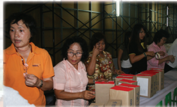
การจัดเรียงขั้นสุดท้าย