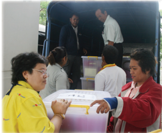
ร่วมมือ...ร่วมใจ...