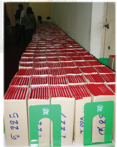
กว่าจะได้แบบนี้... ต้องใช้ใจทำนะครับ...