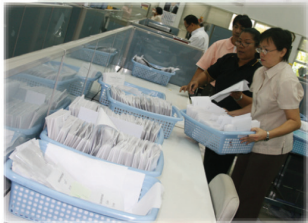
จัดเตรียมเครื่องมือต่างๆ