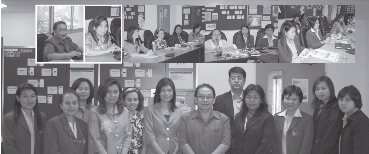
▲ สำนักทะเบียนฯ ต้อนรับ คณะบริหารธุรกิจ มหาวิทยาลัยเทคโนโลยีราชมงคลพระนคร ที่มาศึกษาดูงานของ ระบบจดทะเบียนฯ ทาง Internet ระดับปริญญาตรี และระดับบัณฑิตศึกษา ของสำนักทะเบียนฯ พร้อมทั้งแลกเปลี่ยนเรียนรู้ในการทำงานร่วมกัน เมื่อวันที่ 17 พฤศจิกายน 2552 ณ ห้องประชุมชั้น 2 สำนักทะเบียนฯ