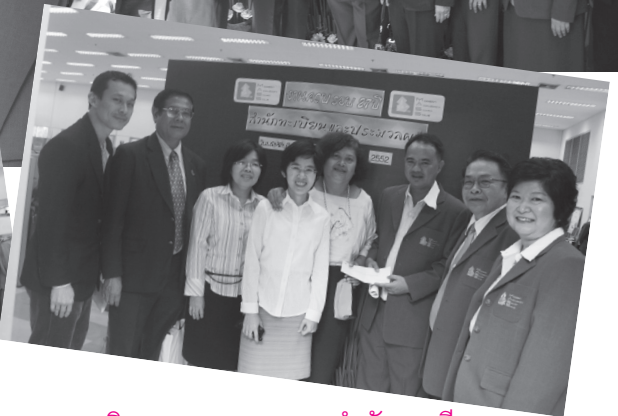
▲ งานครบรอบ 27 ปี สำนักทะเบียนและประมวลผล 12 พฤศจิกายน 2552 ณ สำนักทะเบียน ศูนย์รังสิต และการแสดงนิทรรศการการพัฒนาเทคโนโลยีทางการศึกษาของสำนักทะเบียนฯ