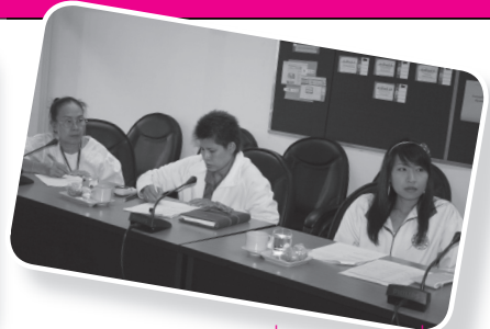
▲ คณะกรรมการ KM ประชุมทบทวนการจัดการองค์ความรู้ และเตรียมความพร้อมในการจัดโครงการเสวนาประสานพื้นที่ห้อง พูดด้วยเรื่องของการบริการทางการศึกษาของมหาวิทยาลัยธรรมศาสตร์ เมื่อวันที่ 5 พฤศจิกายน 2552 ณ ห้องประชุมสำนักทะเบียนฯ ชั้น 2