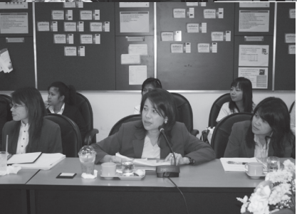
◀ คณะกรรมการดำเนินงานประกันคุณภาพภายใน สนท. (QA1) และคณะกรรมการติดตามและประเมินผลการประกันคุณภาพภายใน สนท. (QA2) ร่วมประชุมเชิงปฏิบัติการ เรื่อง มุ่งสู่การเป็นสำนักทะเบียนต้นแบบ ด้วย MASS เพื่อให้แนวทางการบริหารจัดการองค์กรสมัยใหม่สอดคล้องกับสภาพแวดล้อมที่เปลี่ยนแปลง