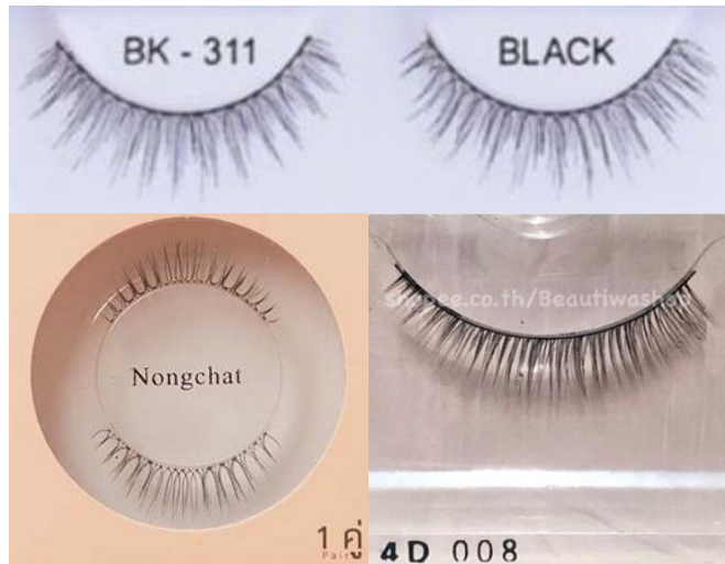
ตัวอย่างลักษณะขนตา