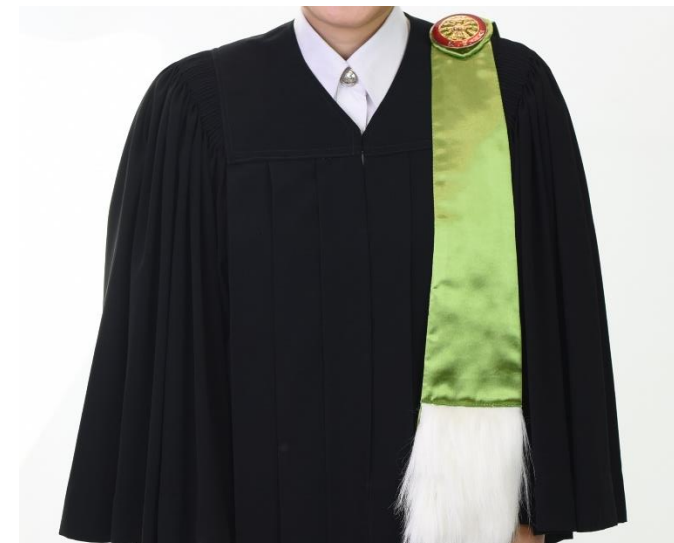
บัณฑิตหญิง