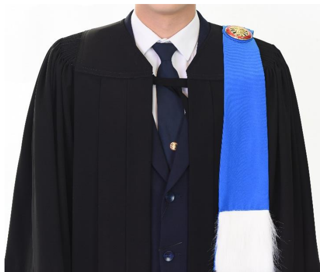
บัณฑิตชาย

พันทบเชือกในลักษณะพาดกัน ไม่ผูกเป็นโบว์หรือปมใด ๆ